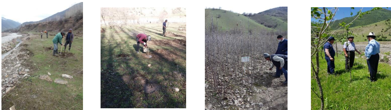
Рис.2. Реализация проекта многоэтажной системы агролесоводства.

Как видно на рисунке 2 в ходе реализации проекта выполнены все основные работы по созданию многоэтажной системы агролесоводства: